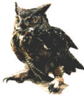
Grand Duc de Virginie Bubo Virginianus