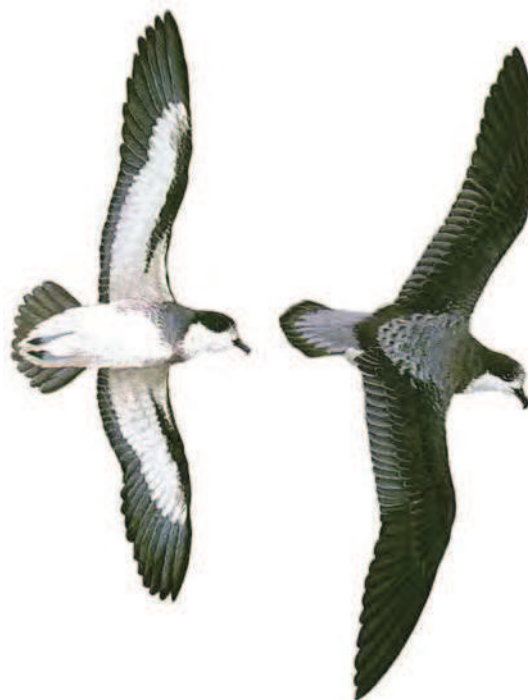
Illustration par Douglas H. Pratt © 1987

Se distingue des autres espèces de Cookilaria par la large marge sombre à l'avant de l'aile. La queue est plus longue par rapport à l'aile que chez le Pétrel de Gould.